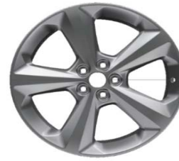
19" (D2VLJ) 235/55 R19