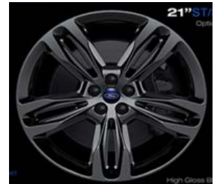
21" (D2HA2) 265/40 R21 Fr. 750.-