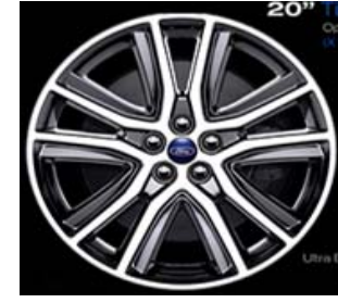
20" (D2FAW) 255/45 R20 Fr. 750.-