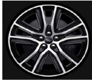
20" 255/45 R20