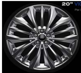
20" ('D2FCQ) 255/45 R20