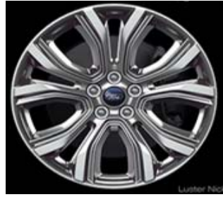
19" (D2VBE) 235/55 R19